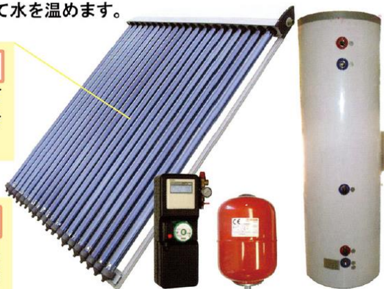
Separation type Premium

晴れた日なら、台所からお風呂まで、一般家庭で使う給湯をこの製品一式ですべてまかなえます。